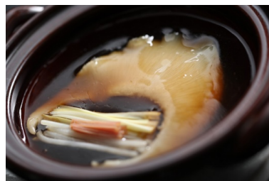
フカヒレの姿煮込み