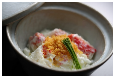
蟹肉の淡雪煮 カラスミの香り