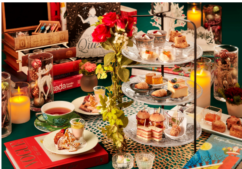
クリスマス特別アフタヌーンティー