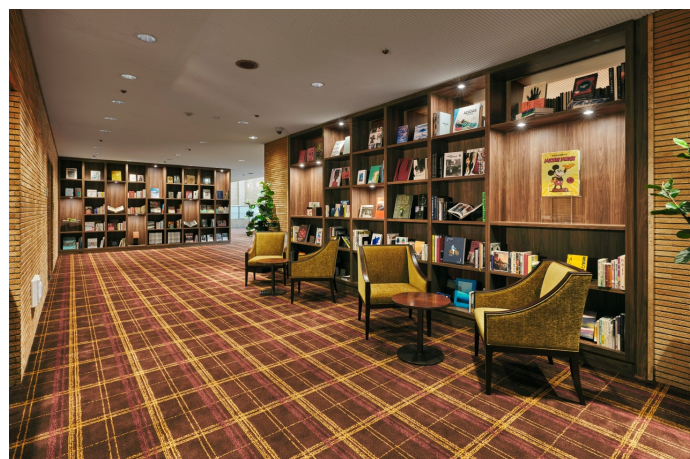
上：2階のブックラウンジ。宿泊客は自由に閲覧可能