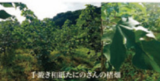
手漉き和紙たにのさんの楮畑