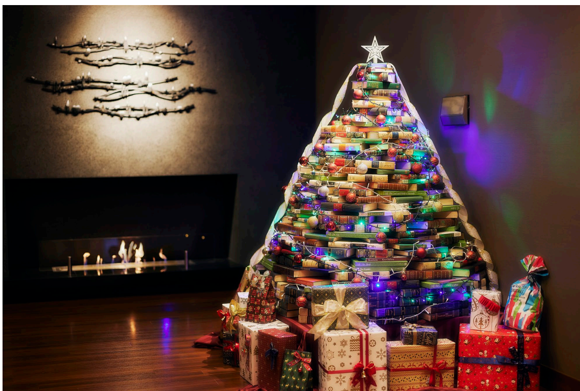
写真：芝パークホテル所有の本で制作したブックツリー（2021年）

皆様のお家やオフィスに眠っている本がございましたらこの機会にぜひご寄付いただきたく、何卒よろしくお願い申し上げます。