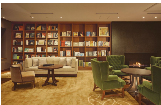
1 階 ライブラリーラウンジ

ホテル館内各所に、銀座蔦屋書店ディレクションの、日本文化から建築、写真、アートまで、幅広いジャンルの 2,000 冊の本が揃うライブラリーコーナーをご用意しています。セレンディピティな出会いと、時間をお楽しみください。