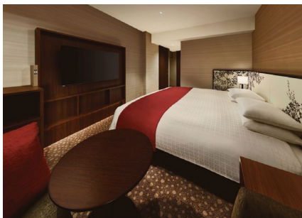
スタンダードキングルーム

当ホテルは 2020 年から 2023 年にかけて全館をリニューアルいたしました。このリニューアルを機に、この街に息づく風土や人、歴史に軸を置く書籍コレクションを備えたライブラリーホテルとしての顔を持ちました。時代を超えて歴史や文化が紡がれてゆき、より良い豊かな明日へとつながる。そんなホテルを私たちは目指していきます。