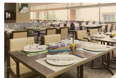
ザ ダイニング 内観