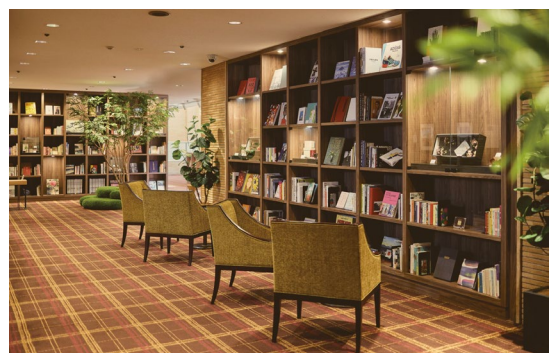
2 階・ホワイエのライブラリーコーナー