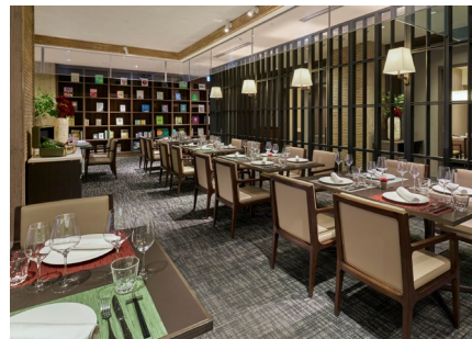
レストラン ザ ダイニング