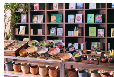
朝食ブッフェにも中華 洋食 和食のお料理が並ぶ

一日の始まりは、シェフこだわりの朝食をいかがでしょうか。地元の旬の食材をふんだんに使用し、サステナビリティに配慮した朝食を提供します。ヴィーガンやベジタリアンの方も楽しめる多彩なメニューで、心と体の健康をサポートし、ゆったりとしたひとときをお届けします。