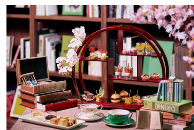
アフタヌーンティーは通年で開催

「ザ ダイニング」では通年で「至福のアフタヌーンティー」を販売中です。中華、洋食、和食のスイーツやセイボリー、お好みの紅茶、そしてお気に入りの本を手には、至福の時間をお過ごし下さい。お一人様からご予約を承ります。